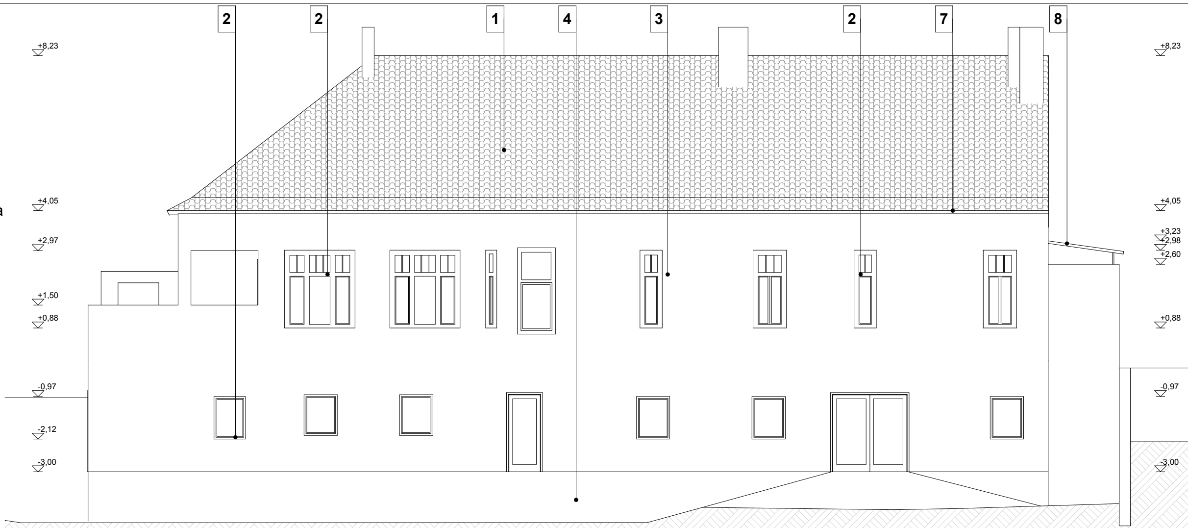
MEGLÉVŐ KELETI HOMLOKZAT M 1:100